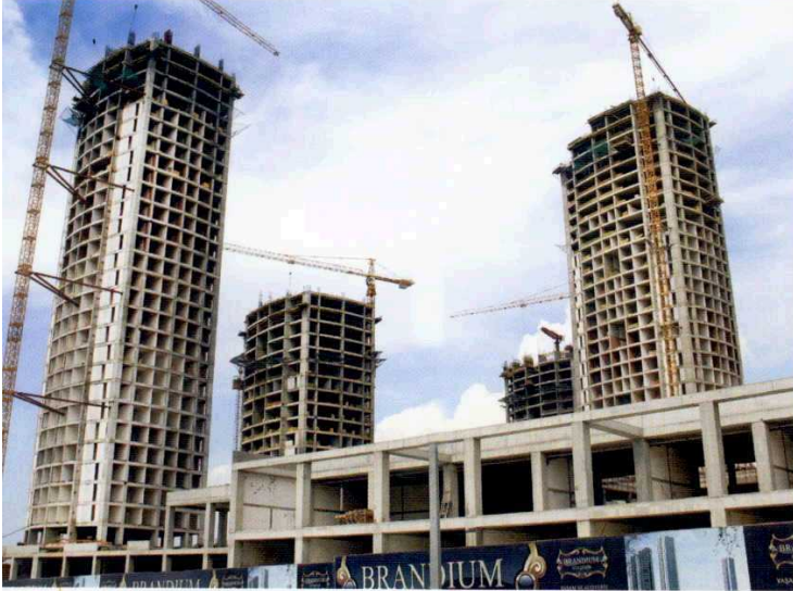
Otel projesi / Yenisahra