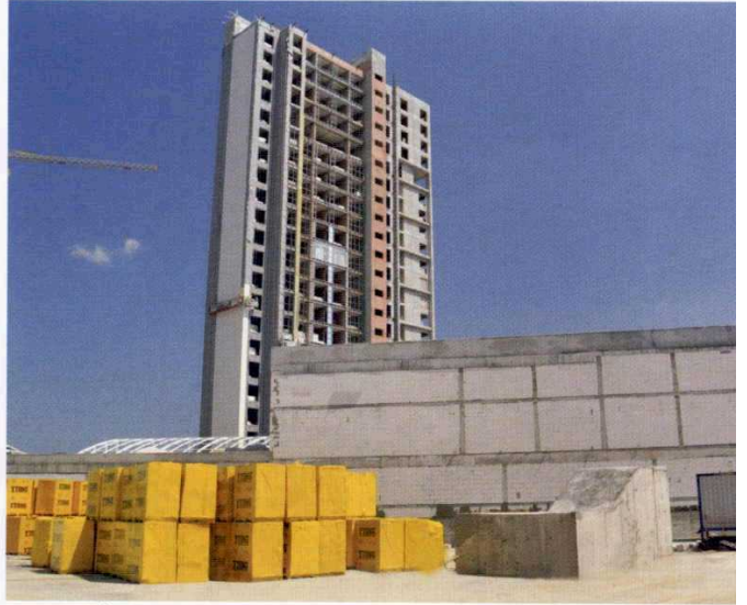
Brandium / Ataşehir